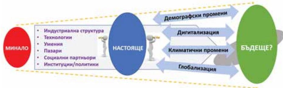
Фиг. 1. Влияние на мегаенденциите върху икономиката